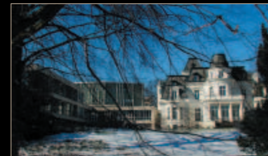
Hochschule für Musik und Theater Hamburg (Germany)

Les pianos à queue Yamaha S4 et S6 offrent la projection et la puissance d'expression d'un authentique piano à queue de concert adapté à des salles de dimensions réduites. Parfaitement adaptés pour le travail de haut niveau, les cours d'interprétation et les concerts, pour les amateurs, étudiants ou professionnels de la musique, ils sont la solution idéale pour la maison, les studios, les petites salles, les clubs, partout où la sensibilité de l'artiste et de son public exigent l'excellence.