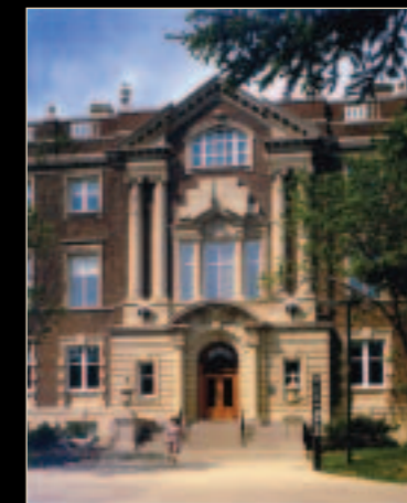
University of Alberta (Canada)