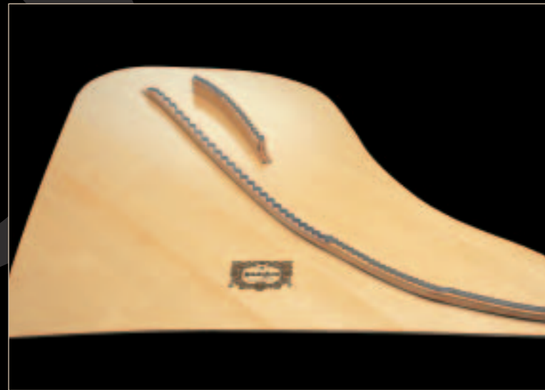
Yamaha grand piano soundboards are crafted from carefully selected and seasoned solid spruce Les tables d'harmonies des pianos à queue Yamaha sont conçues à partir d'épicéa massif, sélectionné et séché avec le plus grand soin