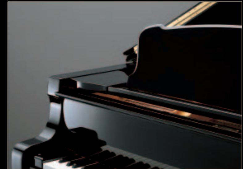
A beautifully crafted music stand Un pupitre au design élégant

For more than 100 years, Yamaha has been passionate about constructing pianos. Using quality materials and superior craftsmanship and design, the S Series continues a tradition in elegant sound and beauty.