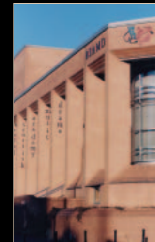
Royal Scottish Academy of Music and Drama, Glasgow (U.K.)