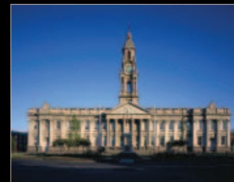
Australian National Academy of Music (ANAM), Melbourne (Australia)