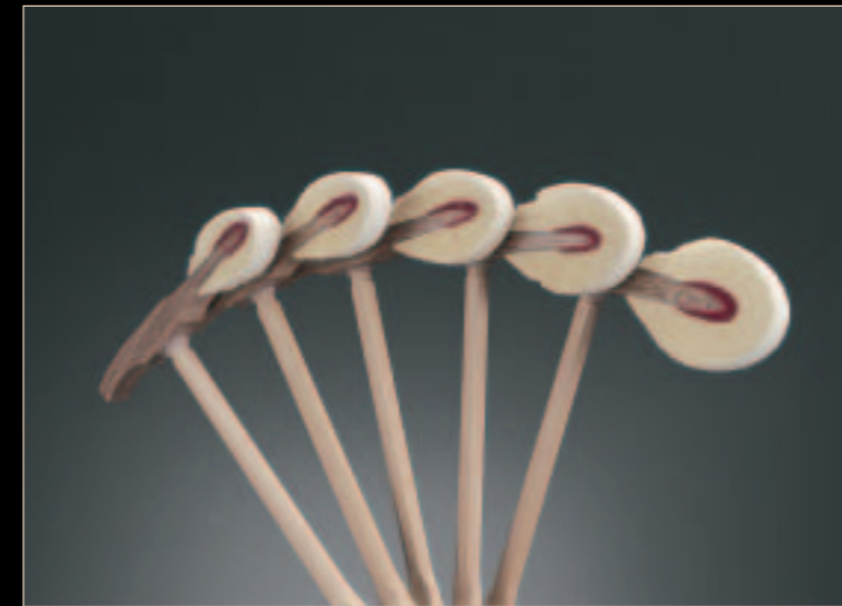
Yamaha hammers are faced with premium quality felt Les marteaux Yamaha sont constitués de feutres de première qualité