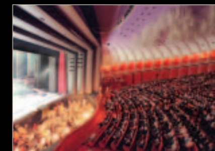
Teatro Regio Sala (Italy)